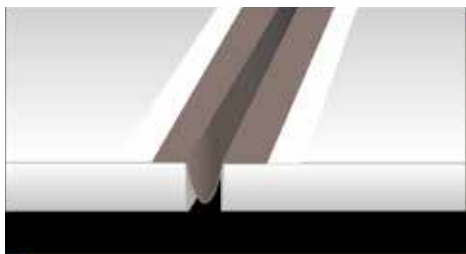
Mapeband PE 120 omega formában elhelyezése mozgási hézagban