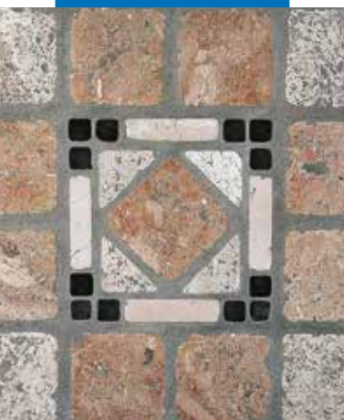
Példa fugázott antikolt márvány padlóburkolatra

A termékre vonatkozó referenciák kérésre rendelkezésre állnak, illetve hozzáférhetők a www.mapei.hu és www.mapei.com honlapokon