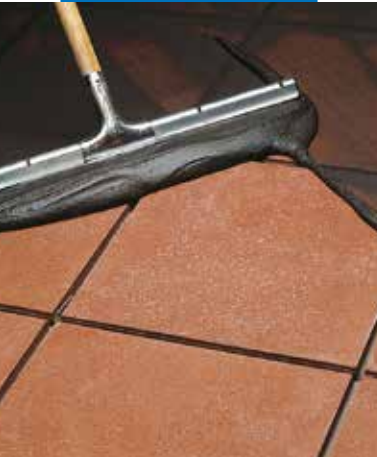
Terrakotta padlóburkoló lapok fugázása gumilehúzóval