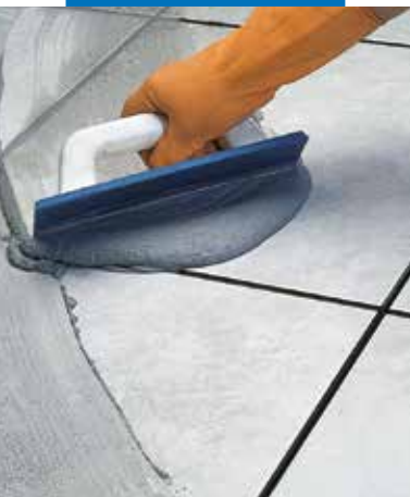
Kerámia padlóburkoló lapok fugázása fugázógumival