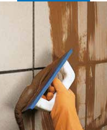
Kültéri falburkolat fugázása fugázógumival

GG fugázóhabarcs végső jellemzői, amely így különleges körülmények között is (homlokzatok, úszómedencék, fürdőszobák, nagyforgalomnak kitett padlók fugázása) megfelelő teljesítményt nyújt. További információt a Fugolastic termékismertetőjében olvashat.