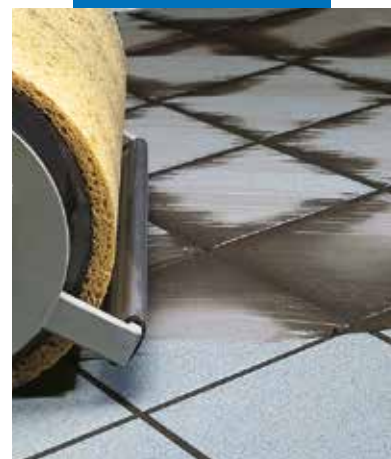
Padló burkolat tisztítása géppel