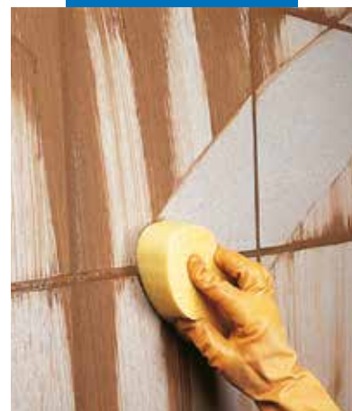
Falburkolat tisztítása tisztítószivaccsal