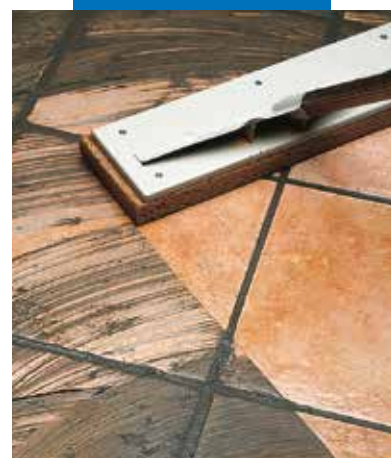
Egyszer-égetett kerámia burkolatú padló tisztítása nyeles tisztítószivaccsal